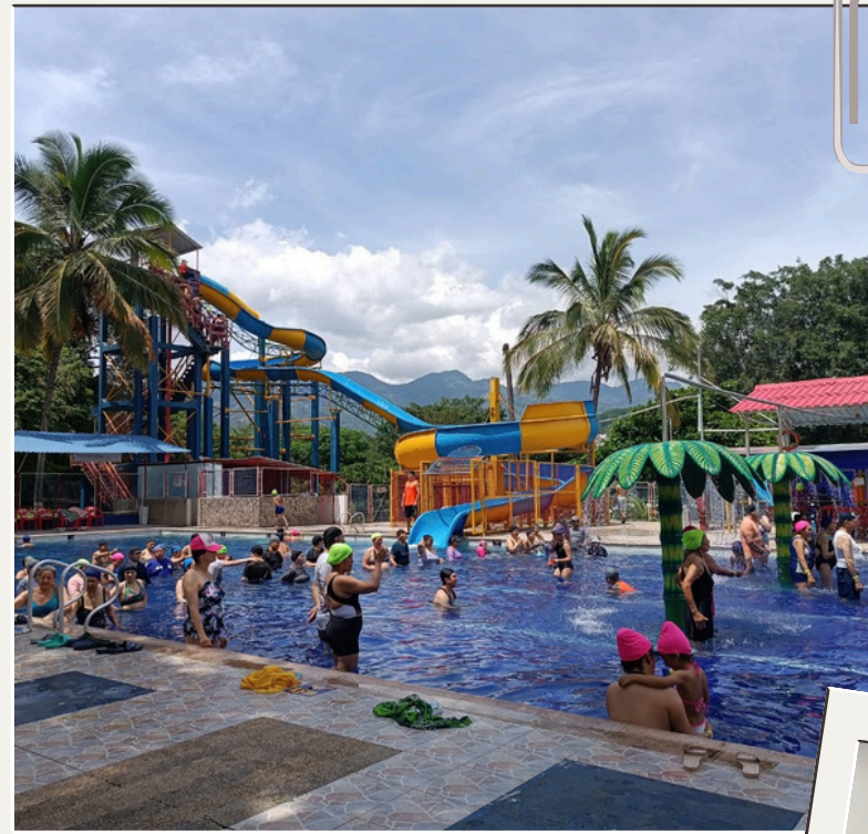
Salida de integración Villeta - 2024