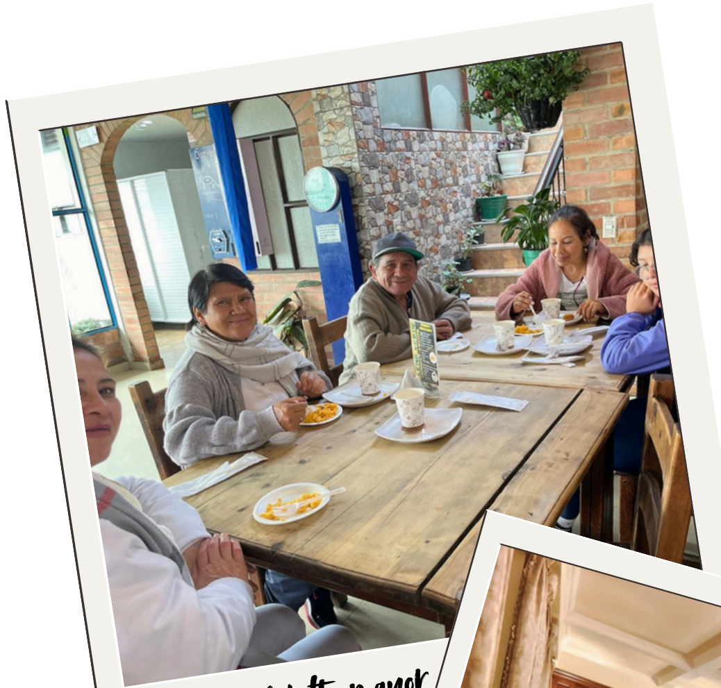
Actividad Adulto mayor Paipa - 2024