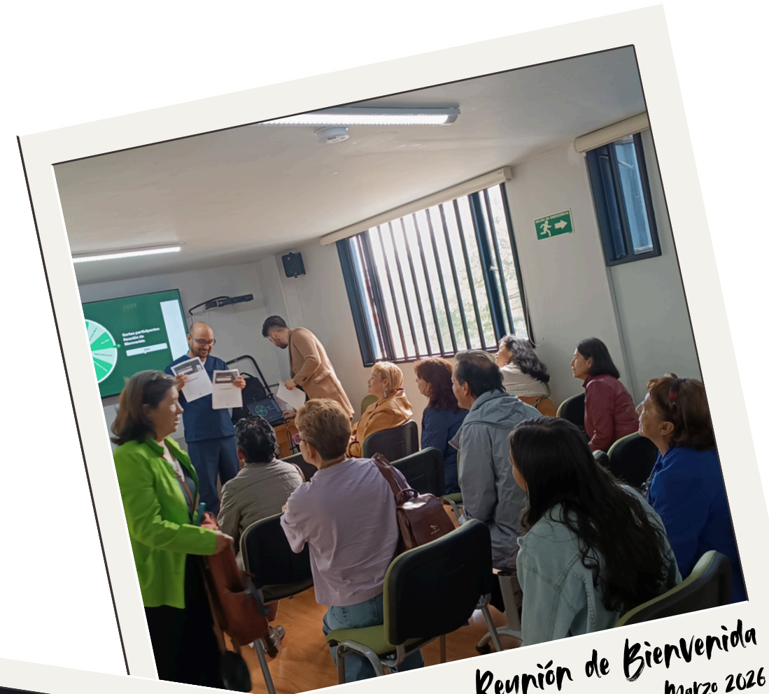
Reunión de Bienvenida Marzo 2026