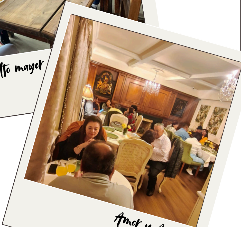
Amor y Amistad Septiembre 2025