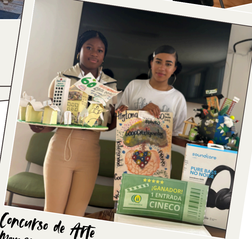
Concurso de Arte Mayo 2026